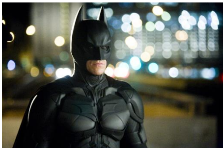
Figure 10 : Plan poitrine. The dark knight (Christopher Nolan, 2008).