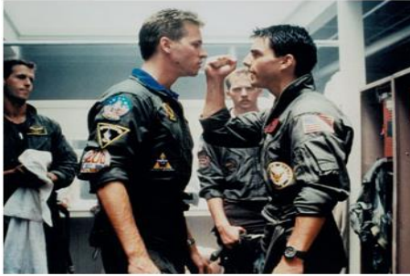
Figure 6 : Plan américain. Top gun (Tony Scott, 1986).