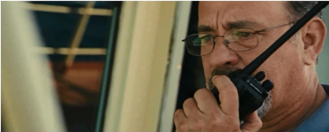
Figure 16 : Caméra portée. Captain Phillips (Paul Greengrass, 2013).