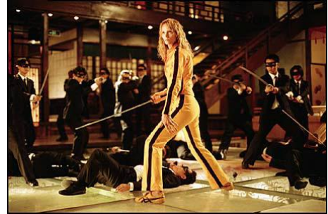
Figure 7 : Plan moyen. Kill Bill (Quentin Tarantino, 2003).