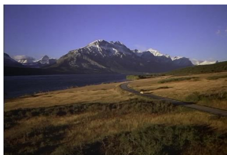
Figure 5 : Plan général. Shining (Stanley Kubrick, 1980).