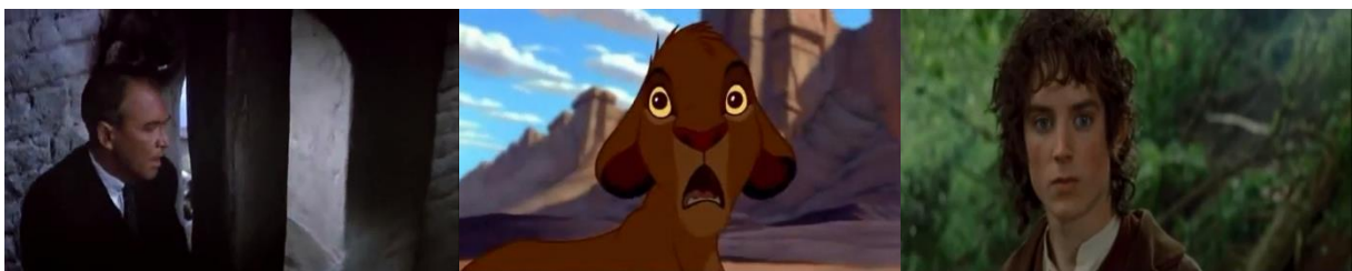
Figure 18 : Travelling compensé ou Effet Vertigo . Sueurs froides (Alfred Hitchcock, 1958), Le Roi Lion (Roger Allers & Rob Minkoff, 1994) et Le seigneur des anneaux : La communauté de l'anneau (Peter Jackson, 2001).