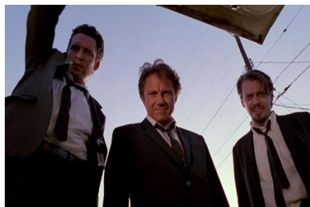
Figure 2 : Contre-plongée. Reservoir dogs (Quentin Tarantino, 1992).