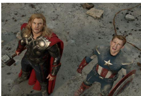
Figure 3 : Plongée. Avengers (Joss Whedon, 2012).