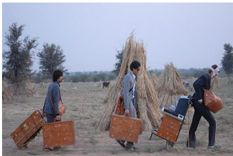
Figure 8 : Plan d'ensemble. A bord du Darjeeling Limited (Wes Anderson, 2007)