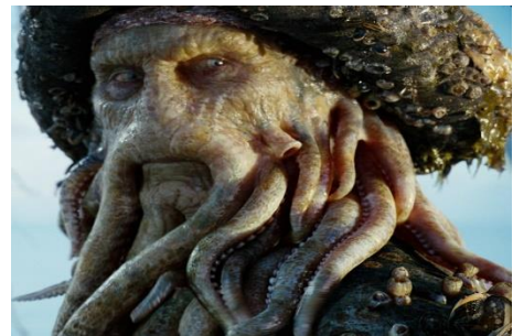
Figure 9 : Gros plan. Pirates des Caraïbes, Jusqu'au bout du monde (Gore Verbinski, 2007)