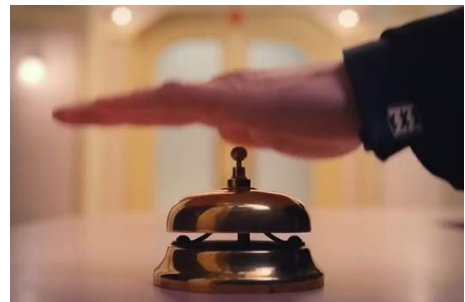
Figure 11 : Très gros plan. The Grand Budapest Hotel (Wes Anderson, 2013).