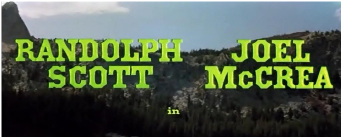
Figure 13 : Panoramique. Coups de feu dans la Sierra (Sam Peckinpah, 1962).