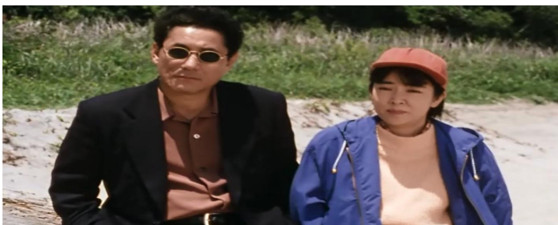
Figure 15 : Plan fixe. Hana-Bi (Takeshi Kitano, 1997).