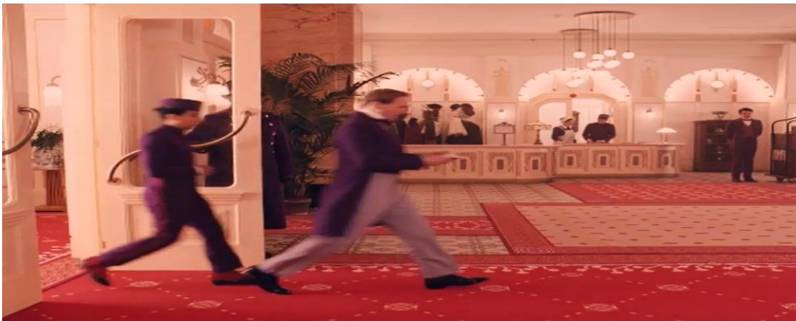
Figure 17 : Travelling. The Grand Budapest Hotel (Wes Anderson, 2014).