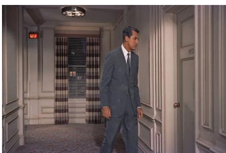
Figure 4 : Plan italien. La mort aux trousses (Alfred Hitchcock, 1959).