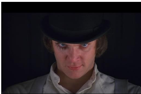
Figure 1 : Angle plat. Orange mécanique (Stanley Kubrick, 1971).