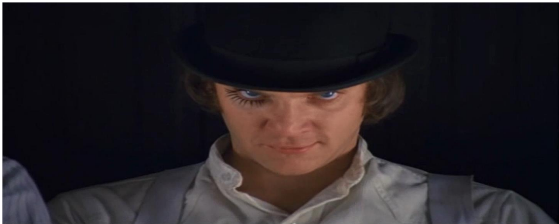
Figure 14 : Zoom arrière. Orange mécanique (Stanley Kubrick, 1971).