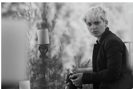
Figure 12 : Plan taille. Beaucoup de bruit pour rien (Joss Whedon, 2014).